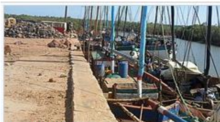
Port de Maintirano